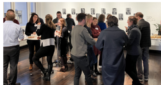
Auftakttreffen der Peer Learning Group CSRD am 29. November 2024 in München

2023 initiierten die bayerischen IHKs bereits die bayernweite Peer Learning Group „Menschenrechtliche Sorgfalt im Unternehmen und bei Lieferanten“ . Die regelmäßigen Treffen bieten den Unternehmensvertreterinnen und -vertretern die Möglichkeit, sich mit den Auswirkungen des Gesetzes auseinanderzusetzen, sie erhielten Tipps zur praktischen Anwendung und entwickelten individuelle Maßnahmenpläne zur Umsetzung in ihren Unternehmen. Im Jahr 2024 wurde das erfolgreiche Format mit Blick auf die CSRD übertragen und eine neue bayernweite Peer Learning Group Nachhaltigkeitsberichterstattung gegründet.