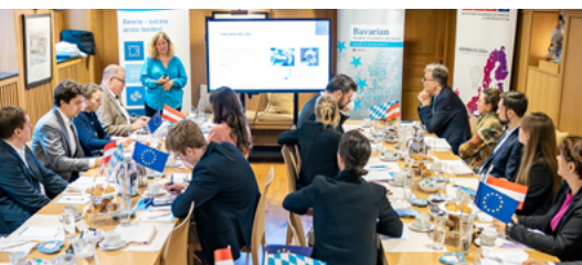
Bayerische Unternehmerinnen und Unternehmer im Austausch mit Vertretern der EU-Institutionen

Mit Blick auf die EU fallen oft Schlagworte wie „Überregulierung“, „Bürokratie“ und „Berichtspflichten“. Aber für die Wirtschaft ist Europa viel mehr: Binnenmarkt, Zollunion, Frieden und geopolitische Stabilität als Wirtschaftsfaktoren sowie ein resilienter und wirtschaftlicher Rechtsrahmen. Zur Debatte über die Zukunft des Binnenmarktes und wie man die richtigen Anreize für mehr Wettbewerbsfähigkeit für europäische Unternehmen setzen kann, luden BHK und WKÖ im Vorfeld der Europawahl Vertreter aus EU-Kommission, Parlament, Mitgliedstaaten und Wirtschaftsorganisationen zu einer Fachdiskussion ein.