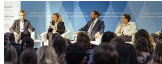
Podiumsdiskussion zur Zukunft Europas

Die gemeinsame Abendveranstaltung der bayerischen IHKS und der EU-Repräsentation der Wirtschaftskammer Österreich zu diesem brisanten Thema traf den Nerv der aktuellen Debatte in Brüssel und ganz Europa – insbesondere vor dem Hintergrund der geopolitischen Umbrüche und der globalen Herausforderungen, vor denen die EU aktuell steht. Zahlreiche Entscheidungsträger aus Politik und Wirtschaft folgten der Einladung in die Bayerische Vertretung in Brüssel.