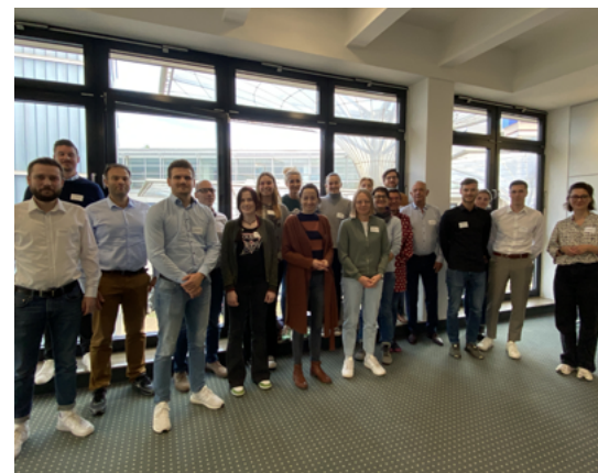
Vertreter von 20 bayerischen Unternehmen nutzten im Rahmen des Zwei-Tages-Workshops in Würzburg die Gelegenheit und den Austausch mit anderen Betroffenen, um sich auf die neue Berichterstattung ab 2025 einzustellen.