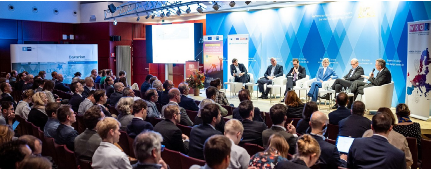
Podiumsdiskussion in der Bayerischen Vertretung in Brüssel am 18. November 2024: Rund 200 Teilnehmer aus Brüsseler Politik und Verwaltung sowie Verbands- und Unternehmensvertreter besuchten die gemeinsame Veranstaltung von BIHK, EEN und WKÖ.