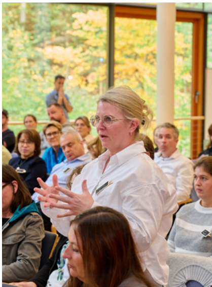
Ausbilderforum im Oktober 2024