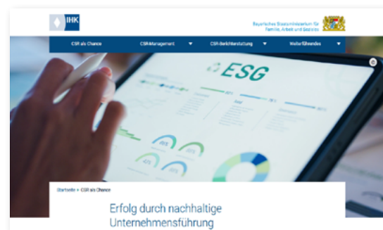
Webportal csr.bayern.de : Ideen zu Stärkung und Ausbau des CSR-Engagements für Unternehmen.