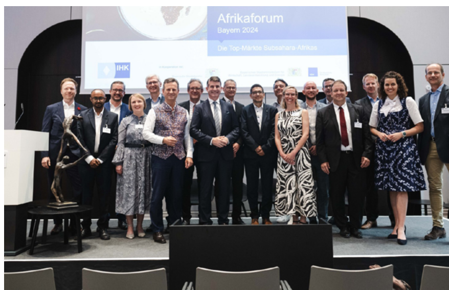
Afrika Forum Bayern: Für einen guten Geschäftsstart in den Ländern Subsahara-Afrikas.