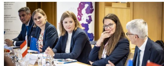
Expertengespräch zur Evaluierung der DSGVO in der bayerischen Landesvertretung am 14. Mai 2024

Im Nachgang zu einem Expertengespräch zur Evaluierung der DSGVO im Mai 2024 befasste sich die Podiumsdiskussion „DSGVO in Zeiten der Digitalpolitik“ mit der Frage, wie ein digitales Europa gelingen kann. Alle Teilnehmer waren sich mit Blick auf die in 2028 anstehende Evaluierung der DSGVO und der KI-Verordnung einig, dass bereits jetzt Gespräche geführt werden müssen. Kooperationspartner waren erneut das Bayerische Staatsministerium des Innern, für Sport und Integration (StMI), die Wirtschaftskammer Österreich (WKÖ) und das Enterprise Europe Network (EEN).