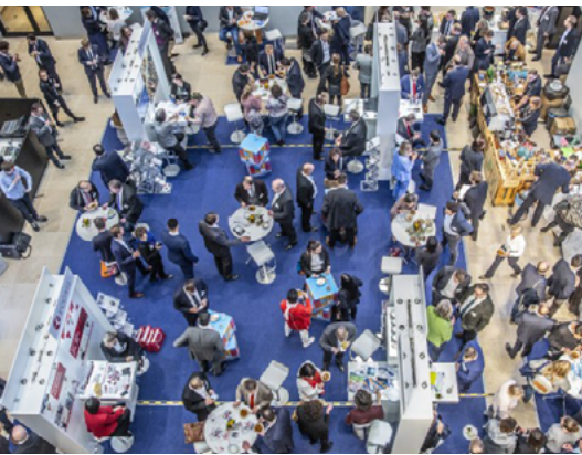
Erfolgreich vernetzen bei der IHK Trade & Connect.