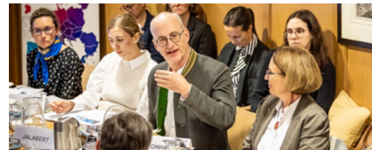
Follow-up Expertenrunde Chemikalienpolitik

Die bayerischen IHKS luden in Kooperation mit dem Enterprise Europe Network zum Follow-Up Expertengespräch zur EU-Chemikalienstrategie in die Bayerische Vertretung in Brüssel ein. Hier tauschten sich Experten zur Zukunft der europäischen Wirtschaft unter REACH-Revision und PFAS-Beschränkungsvorschlag aus. Die Wirtschaft fordert insgesamt mehr Transparenz und verbesserte Kommunikation sowie Pragmatismus von der EU-Kommission. Nächstes Jahr soll ein erneutes Follow-up stattfinden.