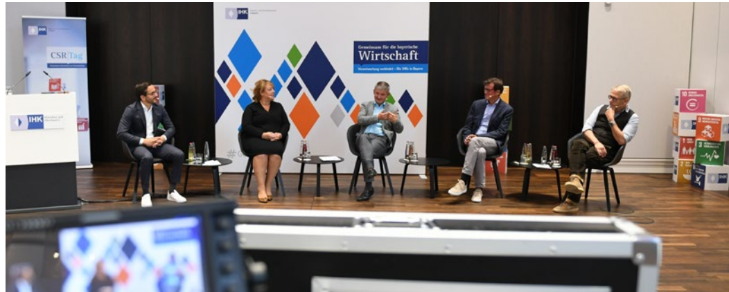
Paneldiskussion „Zur Rolle von Unternehmen im Jahrzehnt der Nachhaltigkeit“