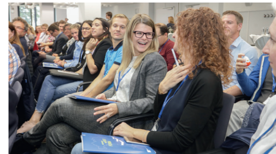
Lernen und gute Laune gingen beim Ausbilderforum 2018 Hand in Hand

Über 29.000 Teilnehmer an Maßnahmen der Sach- und Fachkundeprüfung sowie an AdA- Prüfungen