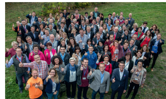
IHK-zertifizierte Ausbilder machen sich fit für die Zukunft