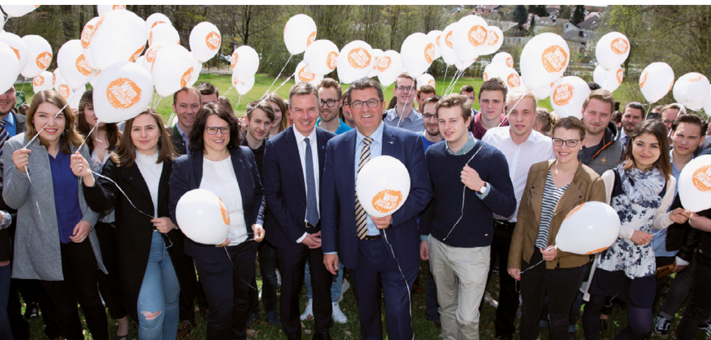
Mehr als 150 AusbildungsScouts aus dem ganzen Freistaat blickten bei einer Veranstaltung am 13.04.2018 gemeinsam mit Bayerns Wirtschaftsminister Franz Josef Pschierer stolz auf die ersten drei Projektjahre zurück.