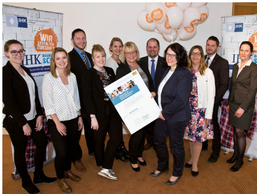
Die Regionalkoordinatoren freuen sich über die Verlängerung des Projektes um weitere 3 Jahre.

Die Regionalkoordinatoren sind die Ansprechpartner für Auszubildende, Unternehmen, Schulen und Öffentlichkeit vor Ort in den bayerischen IHKs. Sie akquirieren die Auszubildenden und Schulen, bereiten die IHK AusbildungsScouts in einem eintägigen Seminar auf ihre Aufgabe vor und vermitteln die IHK AusbildungsScouts an die Schulen. Bei den Besuchen in den Klassen sind die Regionalkoordinatoren nach Möglichkeit dabei.